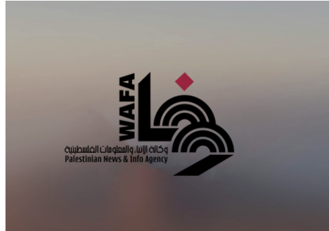
وقف دعم وإسناد للمعتقلين في جنين