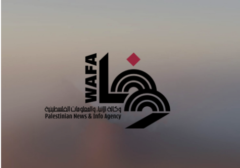
ارتفاع عدد المعتقلات إداريا في سجون الاحتلال إلى 27