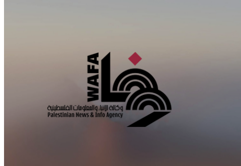
"هيئة الأسرى": إدارة سجون الاحتلال تتعمد تجويع معتقلي "النقب" واهمال علاجهم