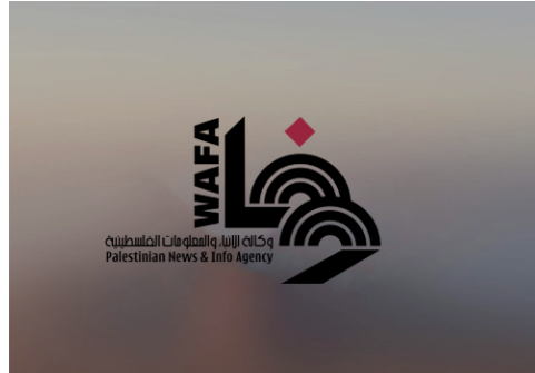
"هيئة الأسرى": إدارة سجون الاحتلال تتعمد تجويع معتقلي "النقب" واهمال علاجهم