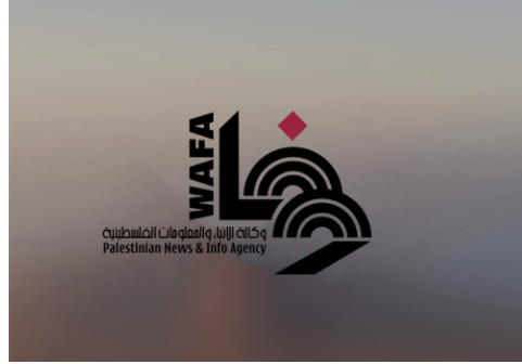
وقفة دعم وإسناد للمعتقلين في جنين