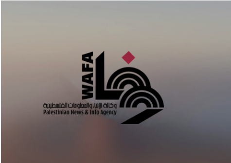
ارتفاع عدد المعتقلات إداريا في سجون الاحتلال إلى